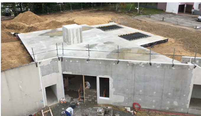
Le local de la nouvelle chaudière bois et gaz