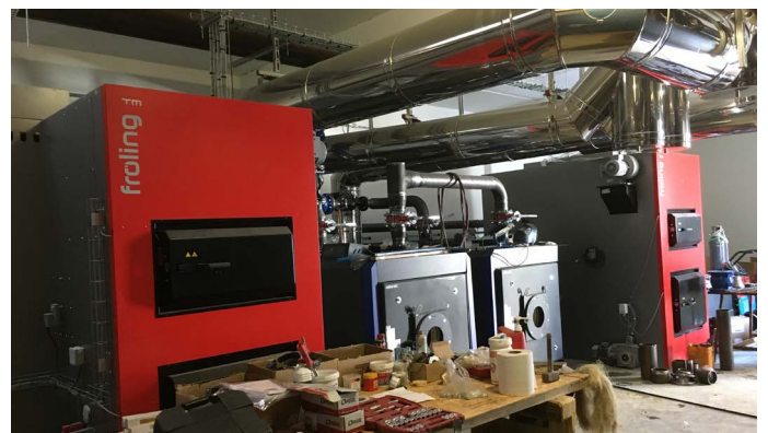
La nouvelle chaudière bois et gaz.