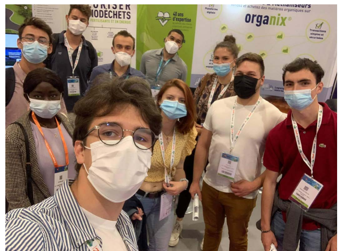
La promo PTVR 2021 devant le stand SUEZ.

En juin dernier se tenait à Rennes le CFIA (Carrefour des Fournisseurs de l'Industrie Agroalimentaire), un salon annuel où se retrouvent de nombreuses entreprises du Génies des Procédés. Deux à trois halls sont d'ailleurs consacrés aux équipements et procédés. Les étudiants ou futurs diplômés de Pontivy peuvent s'y rendre et participer à des ateliers pour trouver des stages, jobs, etc. Comme chaque année, l'équipe de la Plateforme Prodiabio est aussi intéressée par les contacts potentiels au cours de ce salon en lien avec l'agroalimentaire et qui attire de nombreuses entreprises du bassin pontivyen. Dans le cadre de leur cursus, les huit étudiants de PTVR ont pu constater que le domaine des traitements de déchets recrute en ce moment. En