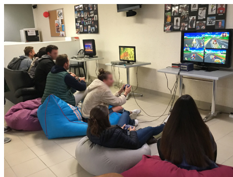
Le stand rétro-gaming de Lorient a eu du succès

CONTACTS : noelie.di-cesare@univ-ubs.fr gaelle.deligey@univ-ubs.fr