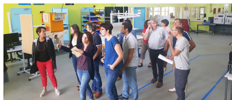
Le Comité de pilotage national en repérage à Lorient.

Le comité national de pilotage est venu repérer les locaux en vue de l'événement où 150 personnes du réseau des IUT sont attendues à Lorient pour échanger sur la thématique des transitions..