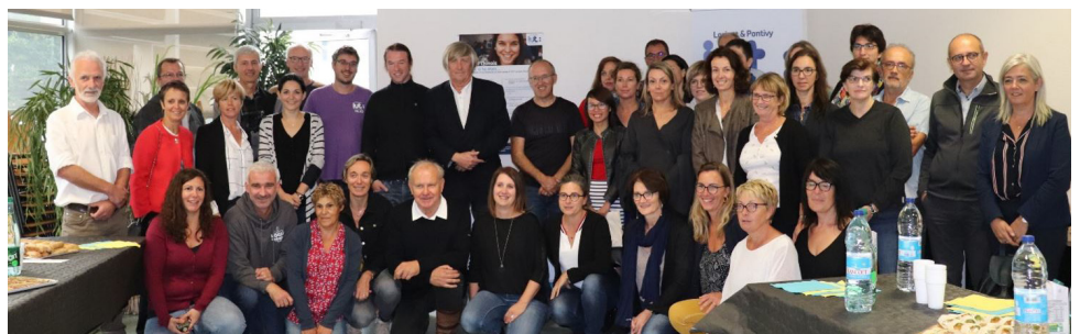
Personnels et enseignants à l'espace Anita Conti de l'IUT de Lorient.

BIJ, Service Jeunesse Ville de Lorient, Croix Rouge, CROUS, CTRL, Théâtre de Lorient, Restos du cœur, Vélo An Oriant, Médecine préventive UBS, Maison du don de Scorff, Centre Nautique de Lorient, Crédit coopératif, Youth for climate.