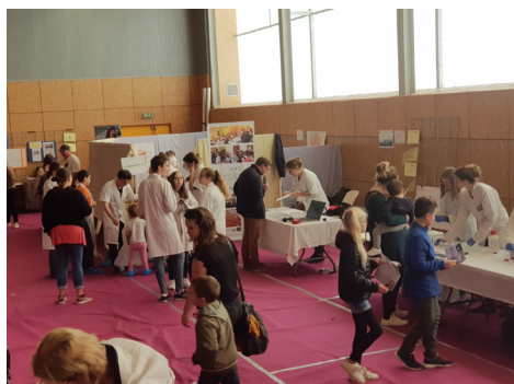
Le public parcourant le salon de Pontivy pour résoudre l'enquête

Tout d'abord à Pontivy, le samedi 5 octobre : le Salon des Expertsciences a proposé aux visiteurs de tous âges de résoudre une enquête policière, en comparant les indices d'une scène de crime avec des expériences proposées par les établissements partenaires : l'IFPS (Ecole d'infirmiers), le Fab Lab Bro Pondi, l'électrothèque du Lac de Guerlédan, la Maison pour Tous et le lycée Gros-chêne.