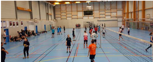
Des étudiants de toute la Bretagne pour cette compétition multi-sports (ici la salle du Volley-Ball)