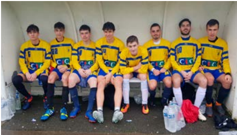
L'équipe de l'IUT gagne la coupe de Bretagne en Football à 7

Bravo à tous les participants et merci à Claude et Agnès pour leur implication dans ce bel événement régional.