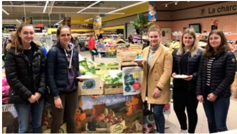
Les 5 étudiantes de QLIO2 lors d'une action de promotion dans une grande surface à Riantec

Chaque année, les étudiants se penchent pendant plusieurs semaines sur le projet d'une entreprise. 5 étudiantes de QLIO2 ont ainsi eu pour mission de promouvoir le chou de Lorient pour le compte d'une association de producteurs de la région lorientaise. Pour améliorer l'image de ce légume produit localement, elles ont notamment participé à des stands sur le marché et dans les grandes surfaces (voir photo de l'article). Elles ont aussi organisé, début février, une soirée événementielle à Sainte-Hélène, avec un repas thématique et des animations musicales durant la dégustation du Kig Ha Farz, un plat breton typique... à base de chou ! La mission est un succès, avec plus de 150 pré-réservations et un événement à guichet fermé. Bravo à elles !