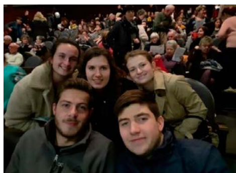
Les étudiants HSE lors d'une représentation.

Le 12 décembre, dans le cadre de leur atelier du jeudi après-midi, la troupe théâtrale de l'IUT était accueillie au Théâtre de Lorient pour une visite très privée ! L'histoire du Théâtre de Lorient, le vocabulaire spécifique du théâtre, les anecdotes, ont été présentés aux acteurs en herbe. Ils ont pu monter sur le plateau démuné de décor, observer la régie technique, visiter les loges, etc. Ils ont aussi découvert la multitude de métiers techniques qui jouent un rôle prépondérant dans de tels lieux : la gestion de la sécurité incendie dans un ERP (Établissement Recevant du Public), la maintenance des centrales de traitement d'air, la régie technique, etc. Des perspectives concrètes pour les étudiants de filières technologiques !