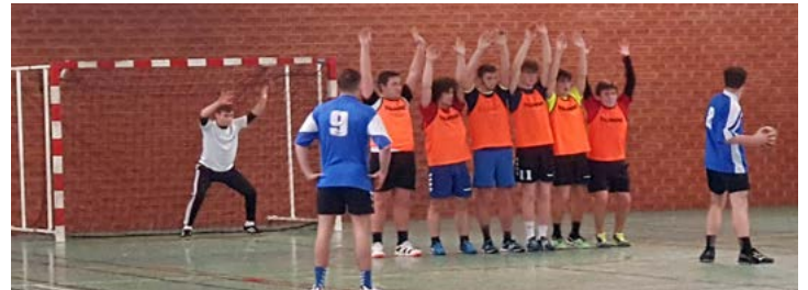
On a vu du beau jeu et du haut niveau (ici le handball à la salle Kervaric)