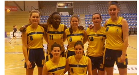
Les filles se sont bien défendues dans le tournoi basket