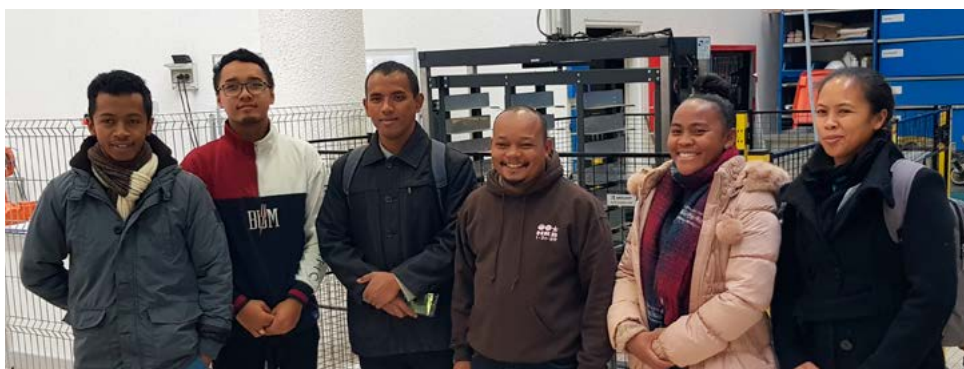
Rencontre entre deux étudiants en GIM et les enseignants malgaches lors de la visite des ateliers